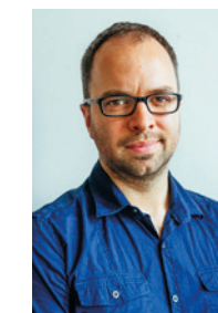
Guillaume Landry Director General Oficina Internacional de los Derechos del Niño

La Oficina agradece el trabajo realizado con sus asociados en este proyecto, y espera que este repositorio sea útil y utilizado por muchos de sus actores y actrices involucrados en la protección de los niños de todo el mundo.