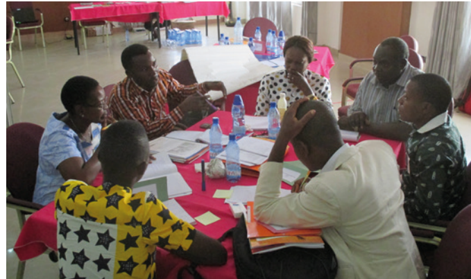
Taller regional en Cotonou, Benin, 2016