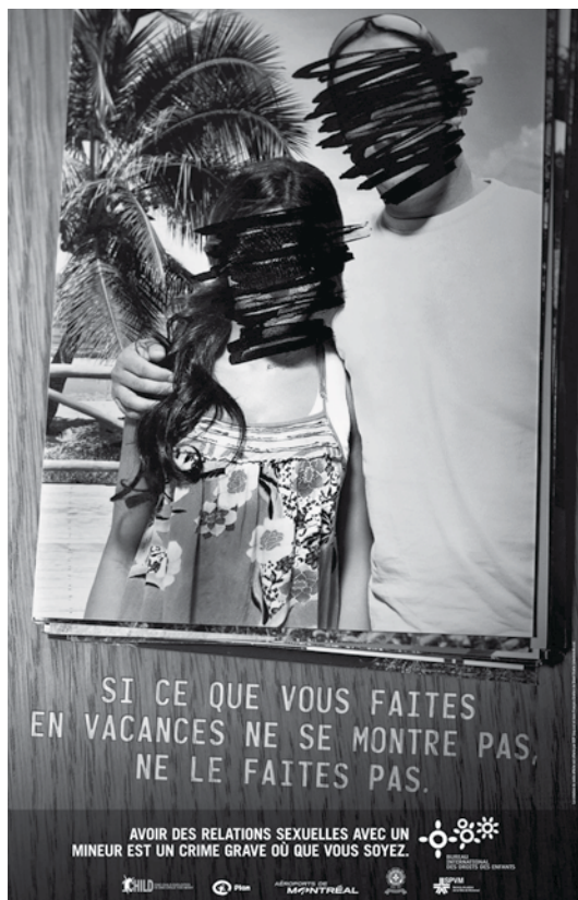
Affiche de la campagne (version française)